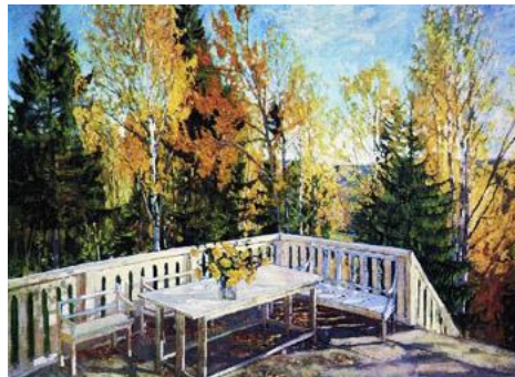
С. Ю. Жуковский «Осень. Веранда».