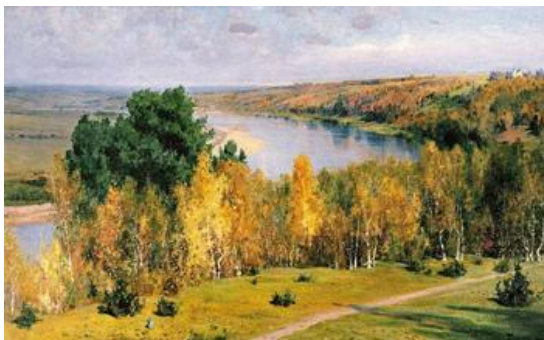
В. Поленов, «Золотая осень».

Педагог: Давайте посмотрим и полюбуемся осенними пейзажами известных художников. На доске репродукции картин В. Поленова, С. Ю. Жуковского, В. В. Мешкова, И.И.Левитана.