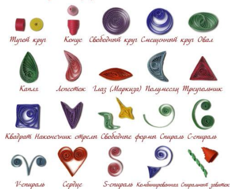
Базовые формы для квиллинга

Всего существует 20 базовых элементов для квиллинга, но принцип остаётся тем же: сворачиваем, прищипываем - используя свою фантазию.