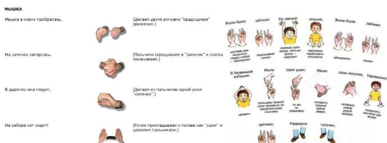
Для младшего возраста