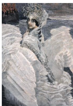
М.А. Врубель Царевна-Лебедь