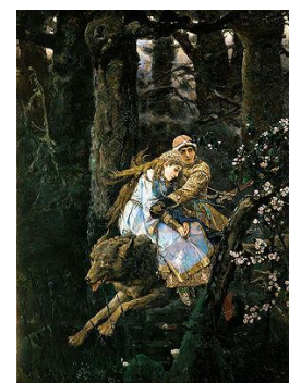
В.М. Васнецов Иван-царевич на Сером Волке

Подготовиться к такому походу просто – читайте ребенку русские народные сказки. Показывайте ему открытки или книги с репродукциями картин художника, фильмы. Прейдя в музей, ребенок сам с радостью узнает старых знакомых.