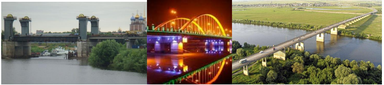
Известные архитектурные сооружения России и мира. Слайд 5